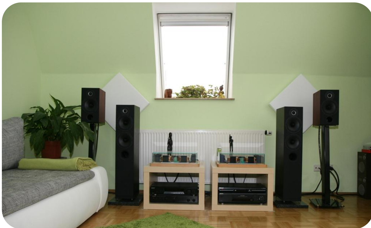
Tesi 560 mit ihrer kleinen Schwester Tesi 260