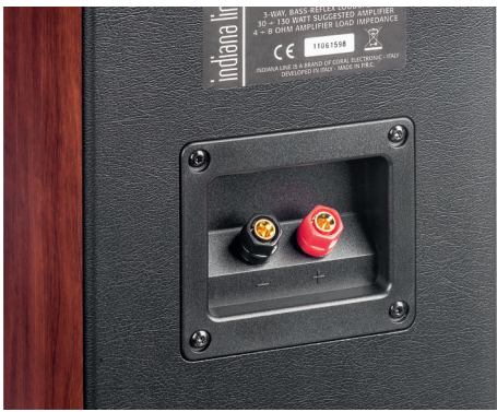
Stabile Schraubklemmen für Lautsprecherkabel, alternativ können „Bananas“ verwendet werden

mit jeder Art von Musik klanglich überzeugen kann. Sein schlankes Gehäuse weiß dazu durch elegante Seitenwangen in Holzoptik zu gefallen. Alles in allem ein bemerkenswerter Lautsprecher – notabene wie der Lateiner sagen würde.