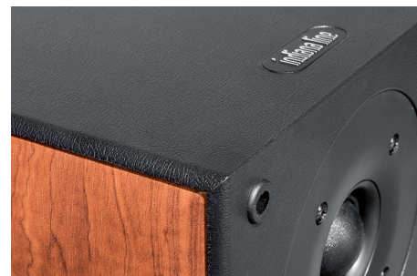
Tadellos ausgeführte Details: Seitenwangen in Holzdekorfolie verleihen der Nota 550 eine elegante Note

Fazit Zu einem äußerst fairen Preis bietet Indiana Line mit der Nota einen ausgereiften, erwachsen klingenden Standlautsprecher, der